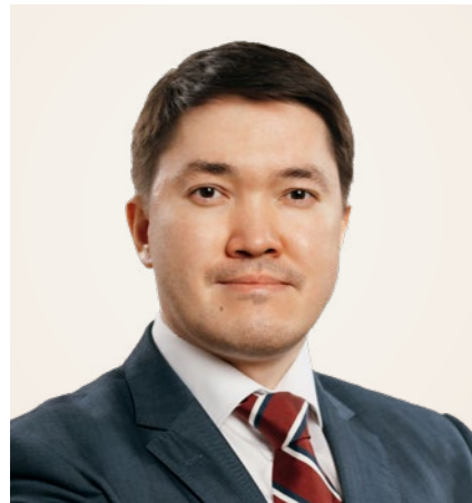
БЕРДИБАЙЕВ ЕРНАТ ҚУДАЙБЕРГЕНУЛЫ ҚМГ Директорлар кеңесінің төрағасы, «Самұрық-Қазына» АҚ мүдделерінің өкілі

2023 жылдың сәуір айынан бастап ҚМГ Директорлар кеңесінің құрамына кіреді.